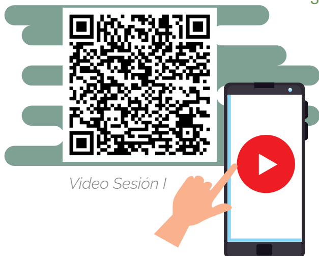
Vídeo Sesión I